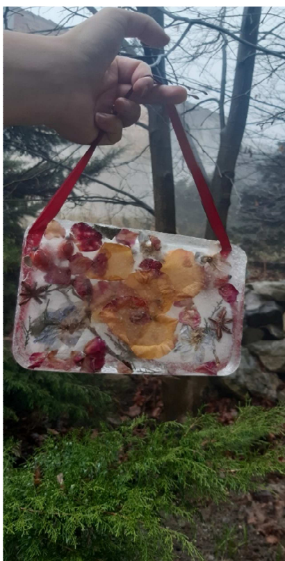
Obrázek č. 2

Evaluaace vnější: Nevšední aktivita vzbudila u dětí velký zájem a nadšení. Každou část úkolu samostatně plnili s drobnou dopomocí učitele. Nejvíce pozitivní emoce probíhala druhý den při vyklopení svého zrcátka z formy.