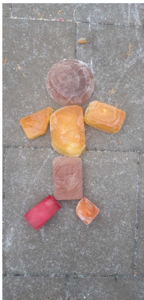
Obrázek č. 5