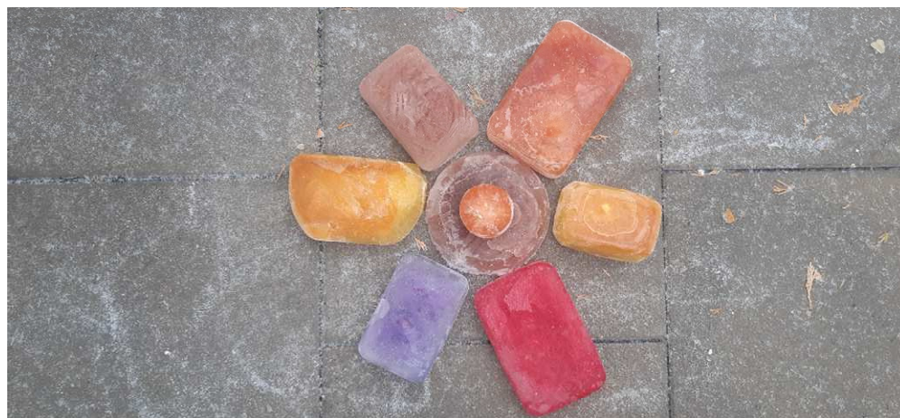
Obrázek č. 4

Evaluace vnější: Aktivita získala velký zájem. Děti byly zaujaty motivačním pracovním úkolem, nejvíce je bavilo malování do sněhu.