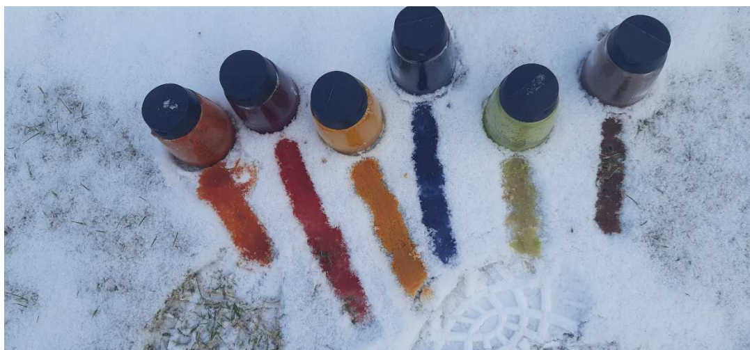
Obrázek č. 3

Motivace: Zima se často označuje za bílou, studenou a nepřístupnou. Ale i toto můžeme výtvarnými aktivitami ovlivnit. Děti ráno získají informaci, že tento den budou kreslit venku na sněhu pomocí nových barev. Aby nepřišly rovnou k hotovým barvám, samy budou zjišťovat, které potraviny, či koření vytvoří určitou barvu. Učitel před děti do řady naskládá všechny suroviny zmíněné výše, může přidat i další navíc. Je dobré si s dětmi vše nejprve pojmenovat, osahat a mít možnost přičichnout, pokud má surovina specifickou vůni. Poté každý na svém pracovním místě dostane papír